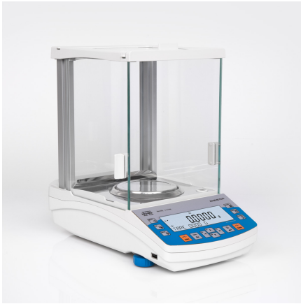
Balance analytique AS 520.R2 PLUS

More information on the website radwag.com/fr/info,w1,N7Z